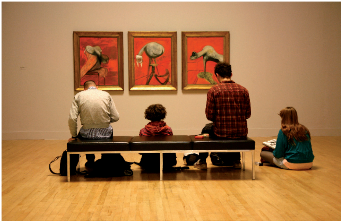
Ryan Gander, Things that mean things and things that look like they mean things , 2008. Collection Kadist Art Foundation (Paris)