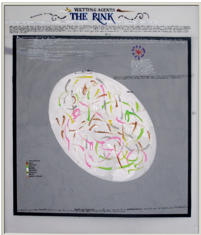
Gilles Barbier Weting agents - The Rink , 2009 Dessin préparatoire. Gouache sur papier