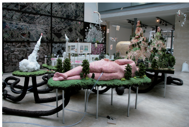
Gilles Barbier La Mégamaquette II , 2006/2008. Technique mixte. Dimensions variables.