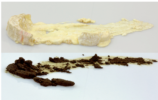
Gilles Barbier Skating camembert et Skating shit , 2008. Technique mixte. 30 x 50 x 80 cm, édition de 3 + 2 E.A.